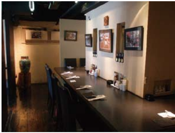
2 店内に並ぶアンティークな飾りや 身体にやさしい生薬