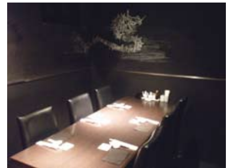
5 ゆったりとした個室