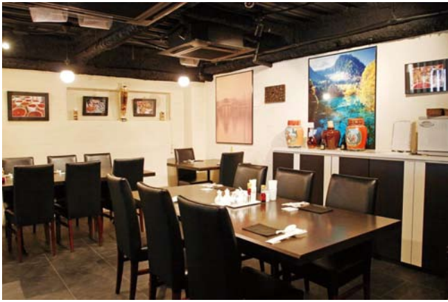
2 店内に並ぶアンティークな飾りや 身体にやさしい生薬