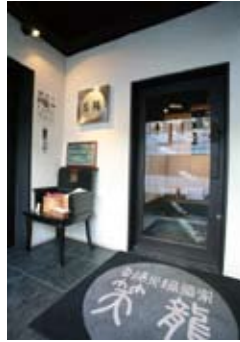
3階エレベーター ホール入り口