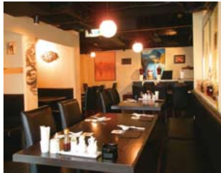
5 中国の雰囲気漂う広々とした店内