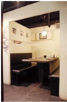
ゆったり ボックスシート