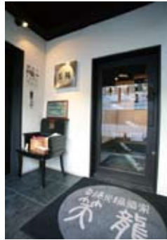
1 2階エレベーター ホール入り口