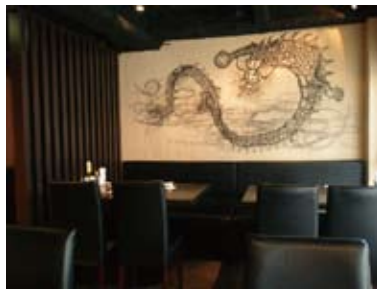
4 龍が絵がかかれた客席