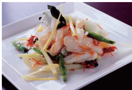
強火で仕上げた「紋甲いかのXO炒め」(1180円)