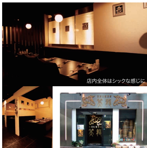
店内全体はシックな感じに