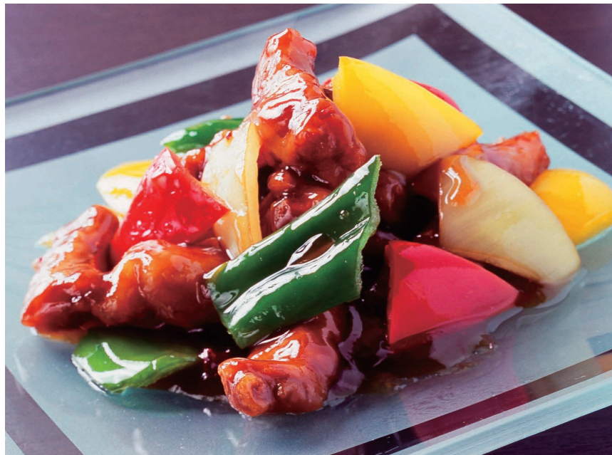
数種の果実酢を使った「笑龍風豚」(880円)

また同店では、中華料理に欠かせな い紹興酒も様々な種類をそろえている。 最高級の「古越龍山陳年15年」や「蘭亭 国宴酒」からスタンダードクラスの3年 ものまで計24品目。今後、品数を倍に 増やしていく考えだ。