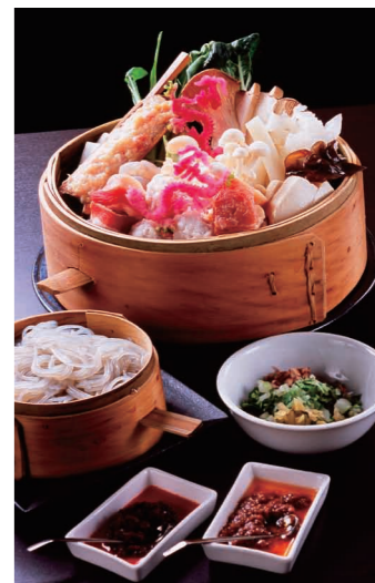
新鮮で豊富な具が揃う