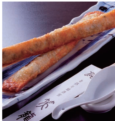
サクサクとした歯ごたえがたまらない「世界一長い海老春巻」(1本~400円)