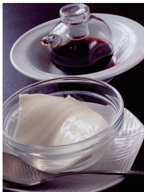
身体にやさしい果実酢添えの杏仁豆腐(480円)。最初に杏仁豆腐を食べた後に、酢だけを一口含んだ時の味は最高