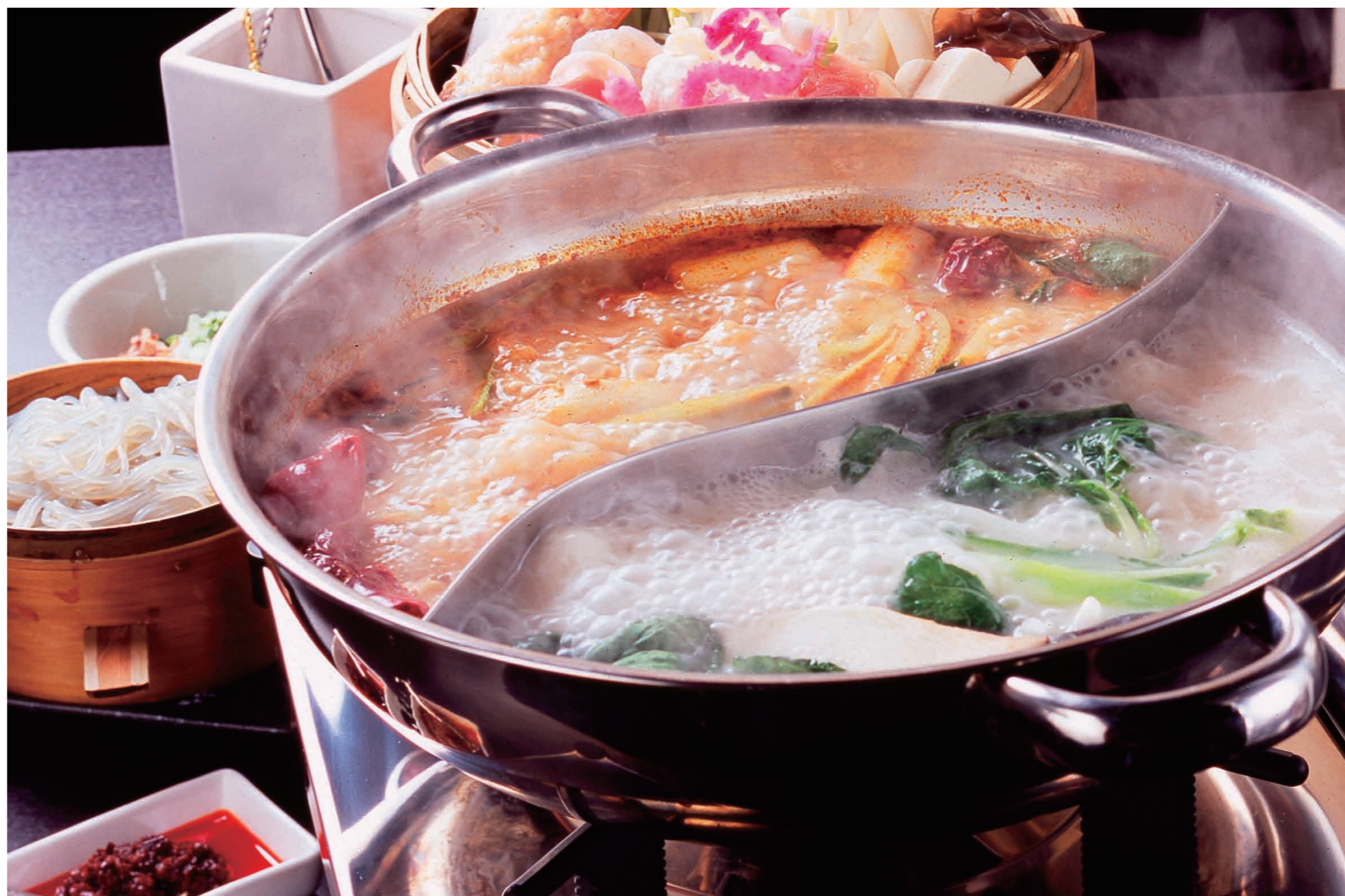
お好みに合わせて選べる2種類のスープ